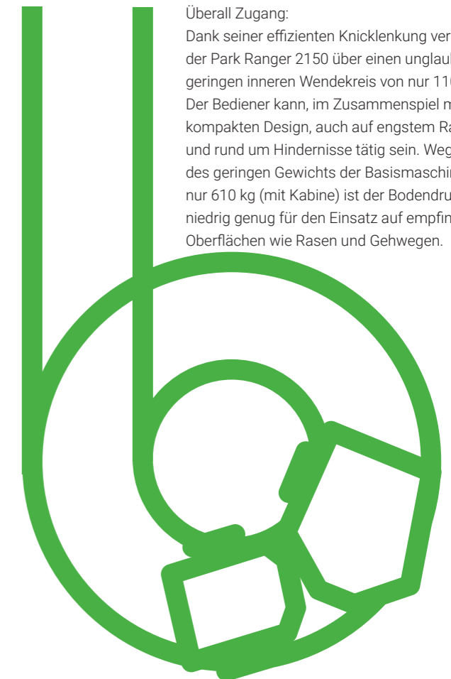
300 cm Wendekreis - Kante zu Kante