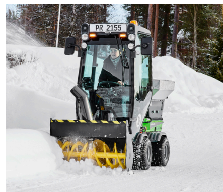
Fraise à neige