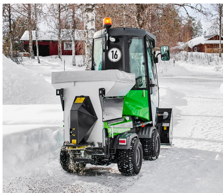
Épandeur de sel et de sable