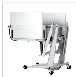
■ Porte-charge avec fonction de bascule