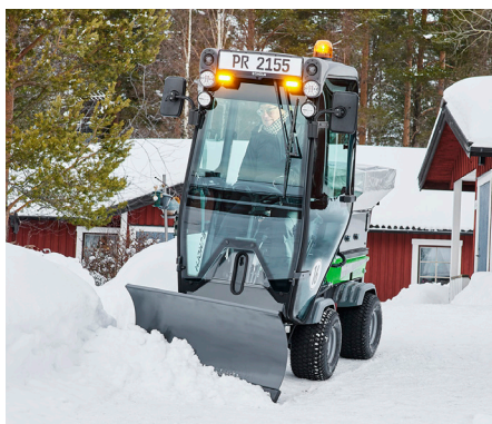
Lame à neige