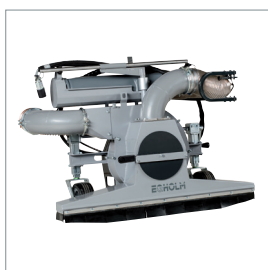
■ Aspirateur de feuilles