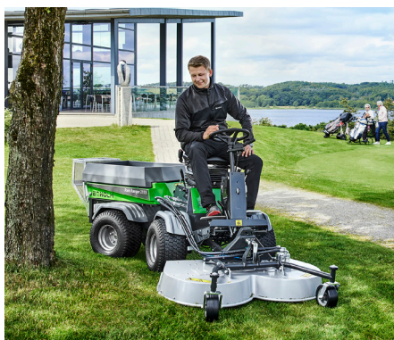
Tondeuse rotative/mulching 1200