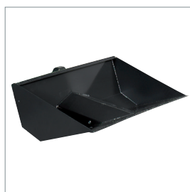
■ Chargeur frontal