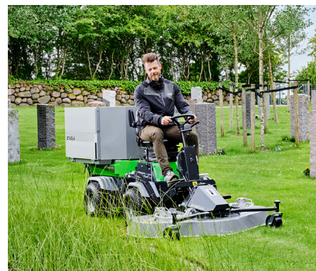
Tondeuse rotative/mulching 1500