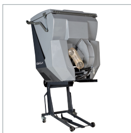
■ Collecteur d'herbe