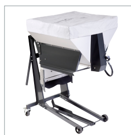
□ Épandeur de sel et de sable