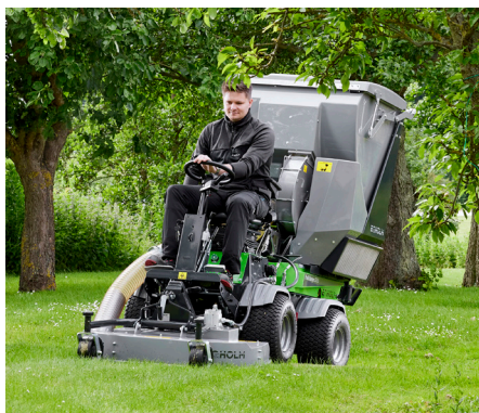
Tondeuse rotative/mulching 1000 avec collecteur d'herbe