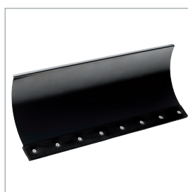
□ Lame à neige