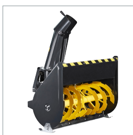
□ Fraise à neige