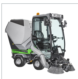
■ Balayeuse aspiratrice