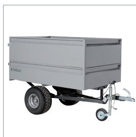
■ Remorque basculante