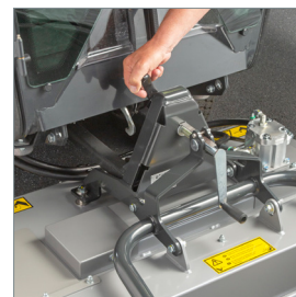
■ Changement rapide d'accessoire sans outil.

Pour plus d'informations concernant le Park Ranger 2155 et ses possibilités d'utilisation, rendez-vous sur www.egholm.fr .