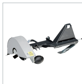
■ Coupe bordures