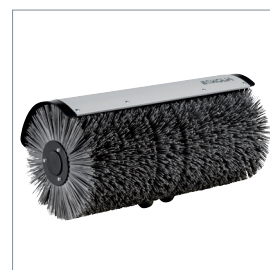
□ Balai rotatif