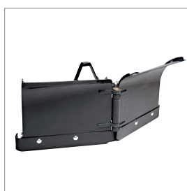
□ Lame chasse-neige en V