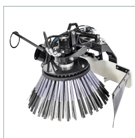
■ Brosse de désherbage