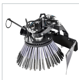
■ Brosse de désherbage