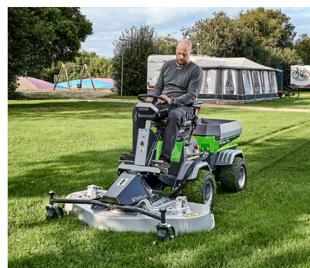
Tondeuse rotative/mulching 1500