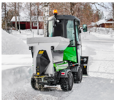
Épandeur de sel et de sable