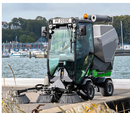
Balayeuse aspiratrice avec 3ème balai