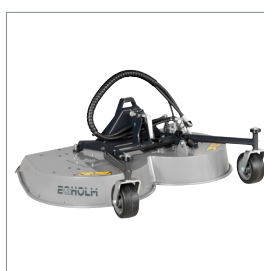
■ Tondeuse rotative ou mulching 1200