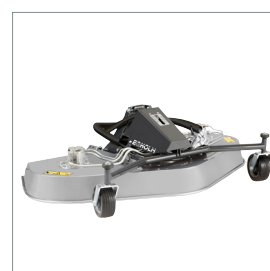
■ Tondeuse rotative ou mulching 1500