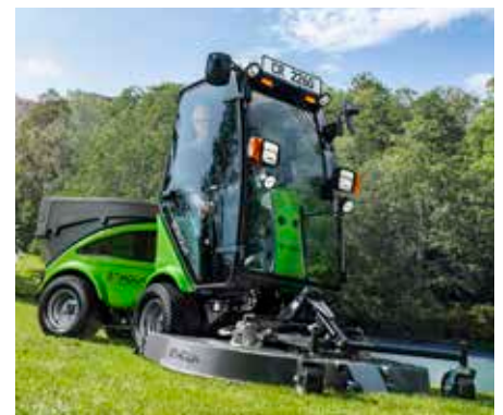
Tondeuse rotative/mulching 1600