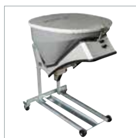
Épandeur de sel et de sable