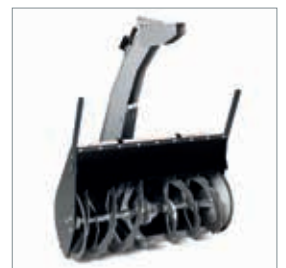
Fraise à neige