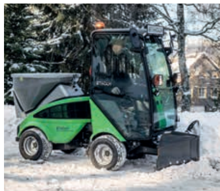
Lame chasse-neige en V et épandeur de sel et de sable