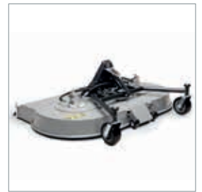
■ Tondeuse rotative ou mulching 1600