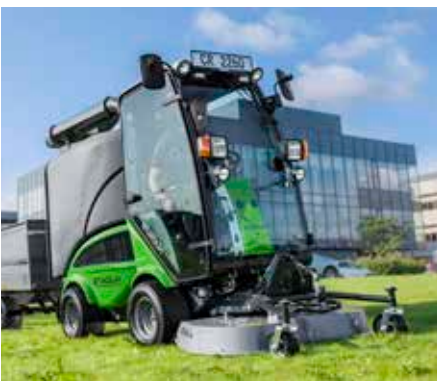
Tondeuse rotative/mulching 1200 avec collecteur d'herbe