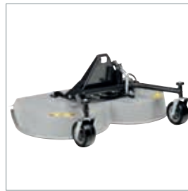
■ Tondeuse rotative, mulching ou collecteur d'herbe 1200