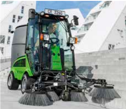
Balayeuse aspiratrice avec 3ème et 4ème balai