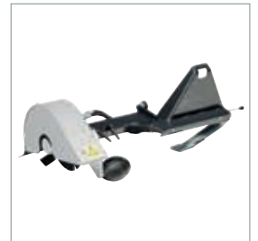
■ Coupe bordures