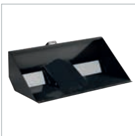
■ Chargeur frontal