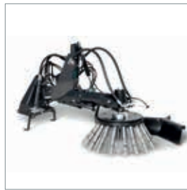
■ Brosse de désherbage