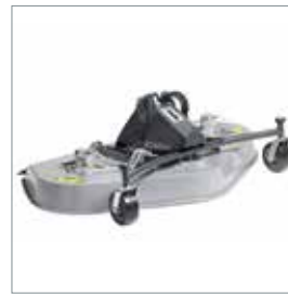
■ Tondeuse rotative ou mulching 1500