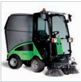
■ Balayeuse aspiratrice

■ Changement rapide d'accessoire sans outil.