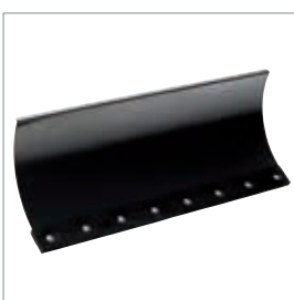
lame à neige