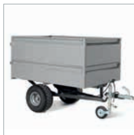
■ Remorque basculante