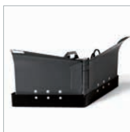
lame chasse-neige en V