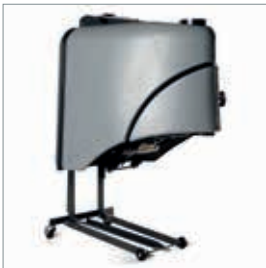
■ Collecteur d'herbe