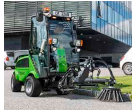
Brosse de désherbage